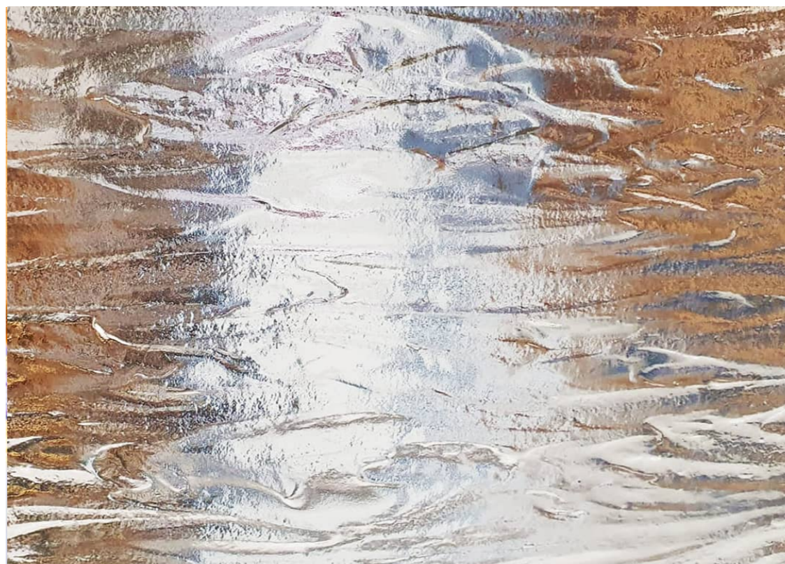
◀ Panneau architectural, motif wave © Arthylæ