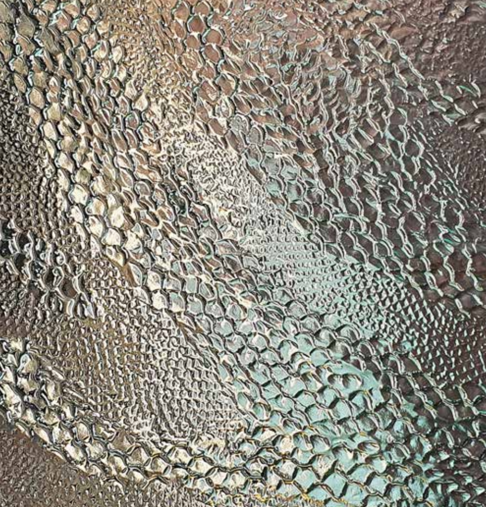
▲ Panneau architectural, motif Reptile © Arthylæ